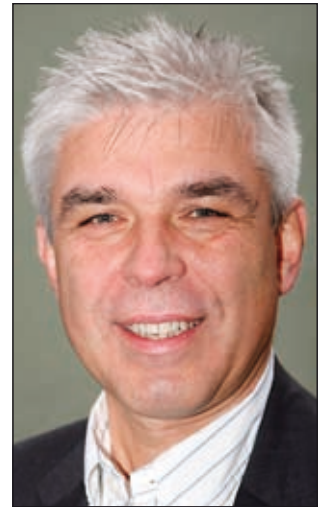
Wolfgang Peterl Bürgermeister der Stadt Korneuburg