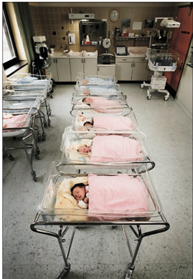
Bis zu 20.000 Blutkonserven werden pro Jahr bei Geburten eingesetzt, wenn Komplikationen auftreten.