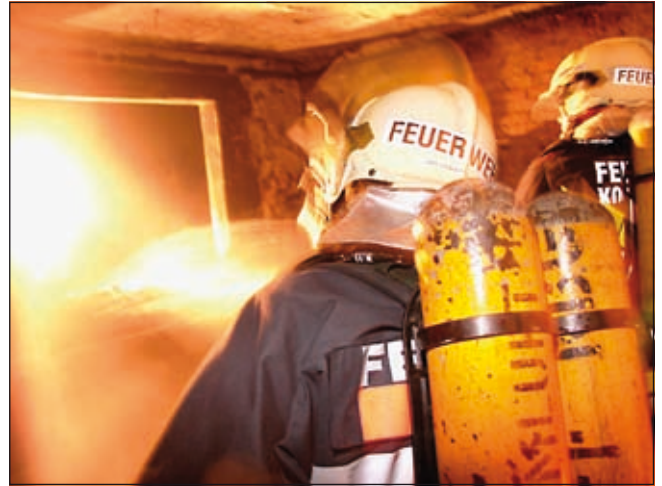
Mit 90.000 Euro finanzierte die Stadtgemeinde die neue Einsatzbekleidung: Sicherheit ist oberstes Gebot.

Daher entschloss sich die Arbeitsgruppe, auch Muster für eine „leichte technische Einsatzbekleidung“ als Ergänzung zur Branddienstbekleidung anzusehen. Der Vorteil liegt nicht nur im Tragekomfort, sondern auch in der Funktionsaufrechterhaltung der Branddienstbekleidung. Denn eine verschwitzte und somit feuchte Schutzausrüstung (PSA) entspricht keineswegs einer funktionierenden Schutzkleidung für die Brandbekämpfung, da Feuchtigkeit die Wärme leitet und somit der entsprechende Schutz durch die Einsatz-