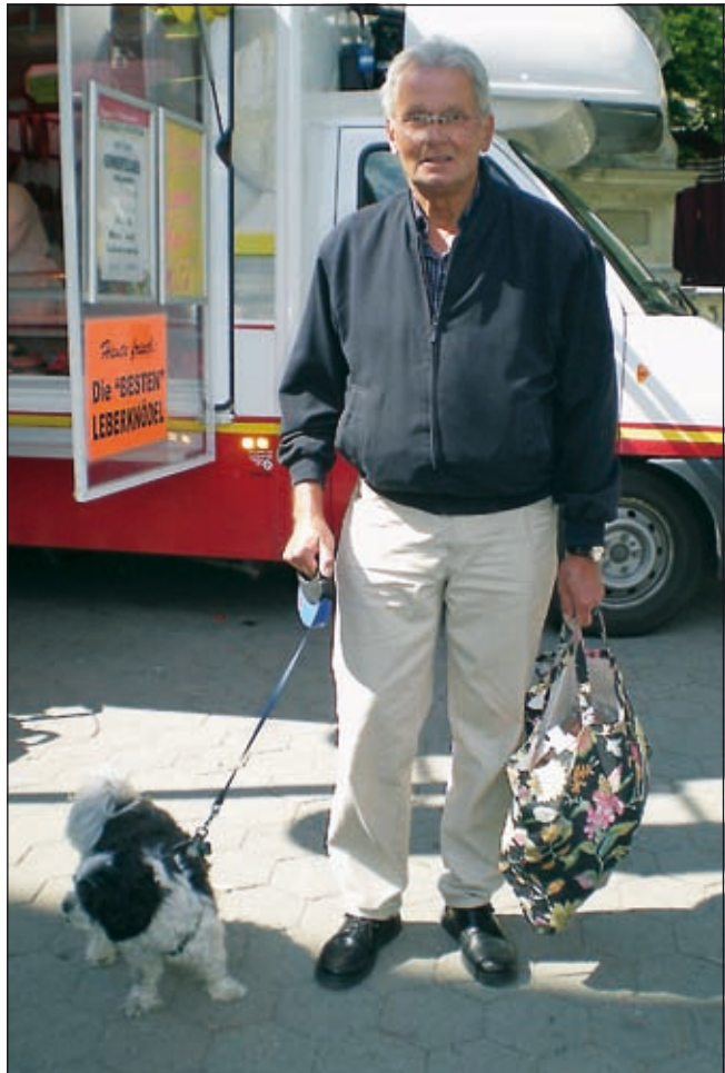
Ein Hund soll Freude bringen und Freunde schaffen.

Beim Gassigehen soll man auch an die Mitmenschen denken, insbesondere wenn sie gehbehindert oder blind sind. Jeder Hundebesitzer kann selbst darauf achten, dass die benützten Gehsteige und Grünanlagen sauber bleiben. Eine nette, aber unendliche Geschichte meinen Sie? Man kann das Problem in den „Griff kriegen“. Denn die Sackerln gibt es kostenfrei, die Stadtgemeinde stellt sie gratis zur Verfügung! Alles ganz leicht, wenn man sich als verantwortlicher Hundehalter fühlt. Denn nicht nur die Fütterung und das Spielen sind für einen Hund wichtig, sondern auch die Spielregeln, um in der Gesellschaft mit dem Hund akzeptiert zu werden.