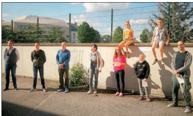
GewinnerInnen, PädagogInnen und Vertreter des Stadtradios Korneuburg freuen sich über die tollen Beiträge und den großen Erfolg des KOCORAKIKO-Wettbewerbs.

Die besten fünf Kinder wurden mitsamt ihren Eltern und PädagogInnen vom Radiosender zu einem Interview eingeladen und bekamen, neben einer spannenden Führung durchs Studio von Radio Korneuburg, auch Urkunden und Preise.