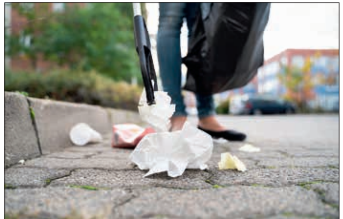
BürgerInnen der Stadtgemeinde helfen dabei, Korneuburg lebenswert zu erhalten.

Die Mindestsicherung greift ein, wenn Arbeitslosenversicherungssysteme oder Erwerbssysteme keine aus-