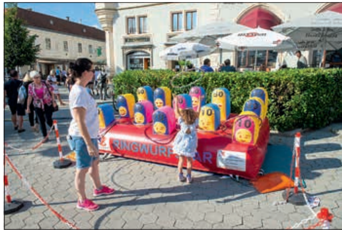
Bei den vielen Actionstationen war auch für alle jüngeren KorneuburgerInnen Spiel und Spaß garantiert.