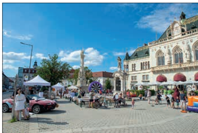
Viele BürgerInnen waren der Einladung des Stadtmarketings Korneuburg und der Wirtschaftstreibenden zur laaangen Einkaufsnacht gefolgt.

Für alle Shoppingqueens und -kings wurde die Korneuburger Innenstadt am 3. Juli zum Shopping-Eldorado mit laaangem Einkaufsspaß.