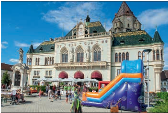
Der Circus Pikard begeisterte mit seinen akrobatischen Walking Acts.